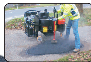
Lex 50 mit 50 l